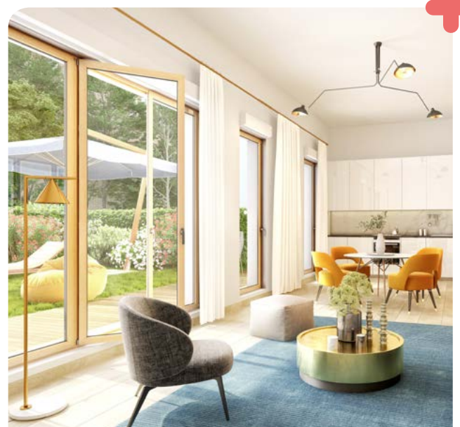
Architecte : Atelier WOA