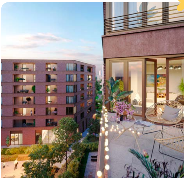
Architecte : Agence NRAU

✘ Contact : 01 41 22 46 46 olea-pantin.fr