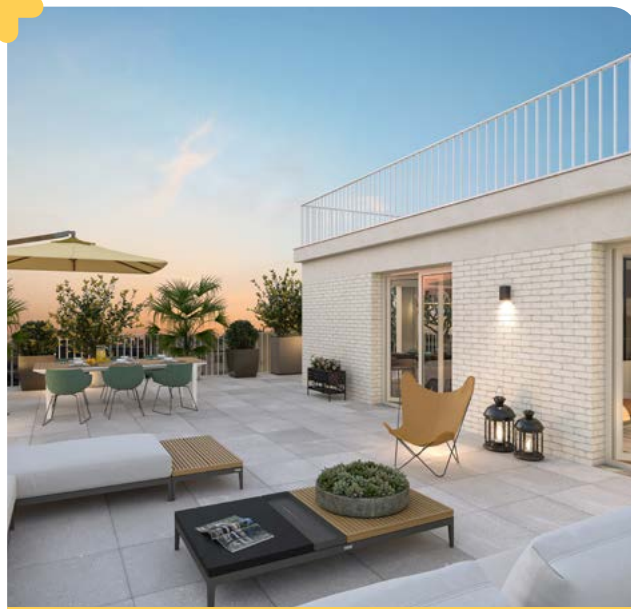
Architecte : Franklin Azzi